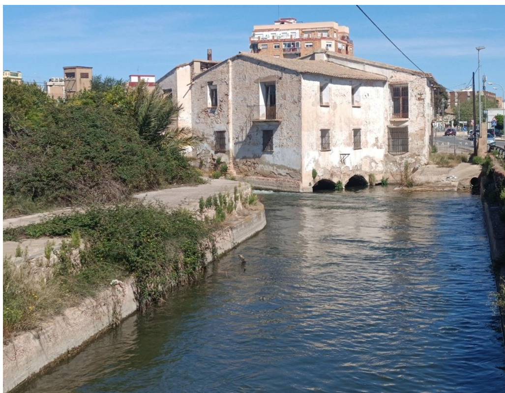
Fig. 3. Molino de Montcada. En 1450, la Orden de Montesa recibía anualmente 1.650 sueldos por el arriendo de este molino harinero.