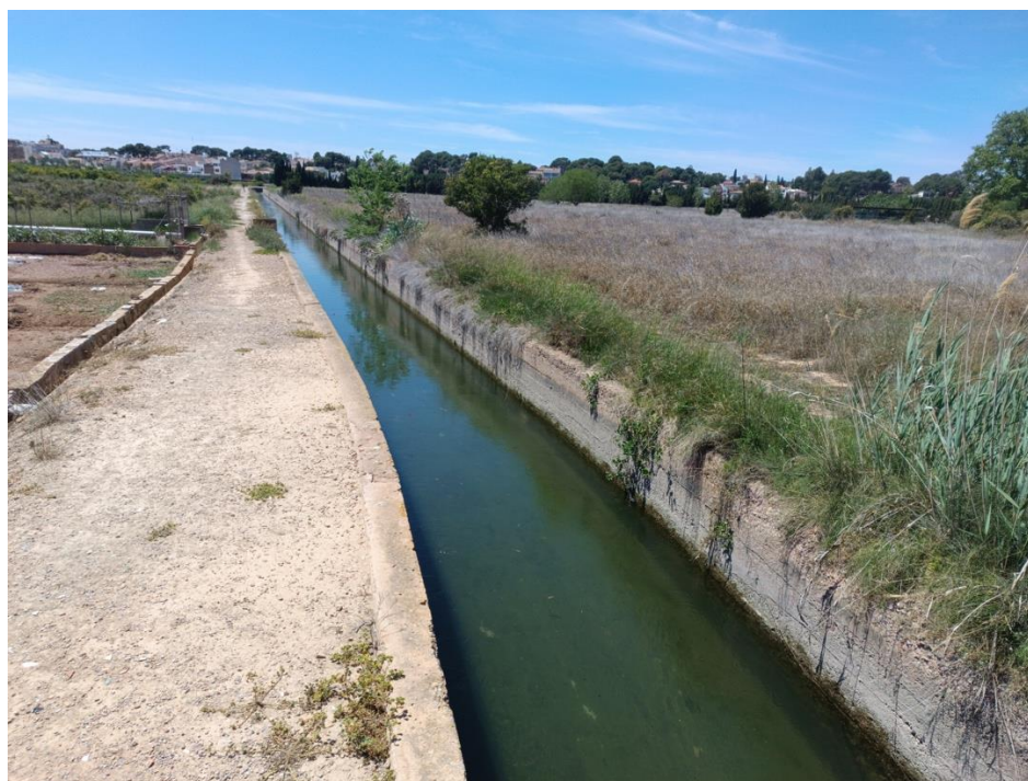
Fig. 2. La acequia de Montcada a su paso por la huerta de Massarrojos.

Moncada (cuyo término municipal casi doblaba el total de las otras tres villas) 19 . Los campesinos acudían a la mesa del notario para traspasar las tierras a sus hijos o herederos; también cuando iban a vender su dominio útil, como les permitía el régimen enfiteútico. Esto generaba un cierto mercado de la tierra, un activo movimiento del usufructo de las parcelas, mientras no cambiaba su titularidad en manos de los de Montesa. La orden consentía estos traspasos porque le permitía cobrar ciertas tasas por la venta, los tradicionales laudemio y fadiga.